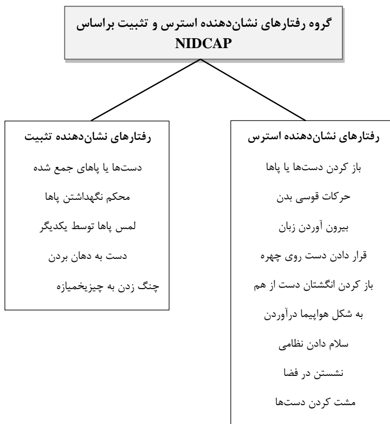
نمودار ۲. گروه رفتارهای نشان‌دهنده استرس و تثبیت براساس NIDCAP

طول مدت مراقبت خوشه‌ای تبدیل مناسب به کار رفت.