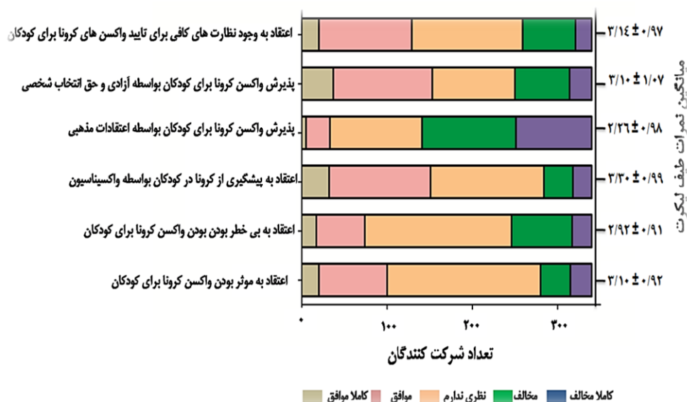
شکل ۳: میانگین نمرات نگرش والدین به واکسن کووید-۱۹ برای کودکان

مطالعه، نگرش والدین به واکسیناسیون کودکان ۵ تا ۱۲ ساله و عوامل موثر بر پذیرش آن را بررسی کردیم. نتایج این مطالعه نشان داد که بیش از ۶۰ درصد از والدینی که دارای کودک ۵ تا ۱۲ ساله بودند، تمایلی به واکسیناسیون کودک خویش در مقابل کووید-۱۹ نداشتند. این در حالی است که در